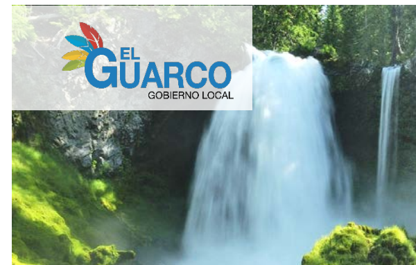
Versión sobre imágenes oscuras